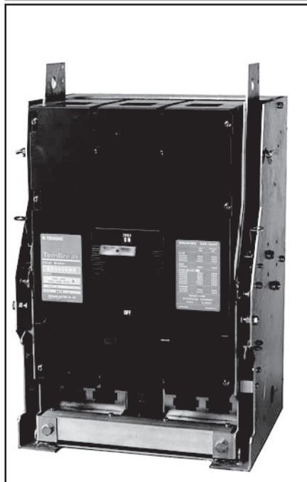
Типоразмер 1600 А