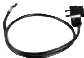
TSX FP CG 010/030