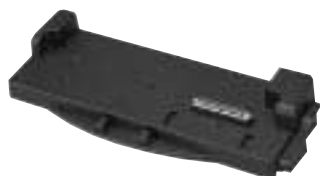
FT 20 VEB 272W