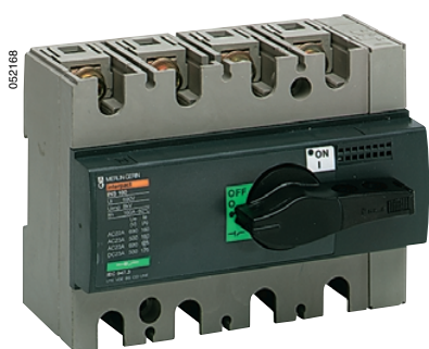
Выключатель Interpact INS160