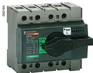
Выключатель Interpact INS80